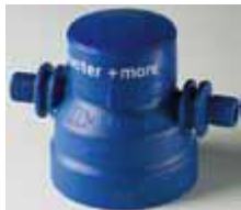
Технология с единой головкой